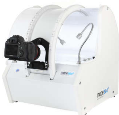
Photo Composer to kompaktowe urządzenie posiadające własne oświetlenie fotograficzne LED, stół bezcieniowy z platformą obrotową do zdjęć 360 stopni oraz ramię do zdjęć sferycznych 3D.

Oferta MODE SA zorientowana jest na rozwiązania do fotografii produktowej, wizualizacji cyfrowej oraz narzędzi do prac konserwatorskich przy ochronie zabytków oraz dla rynku medycznego i kosmetycznego.